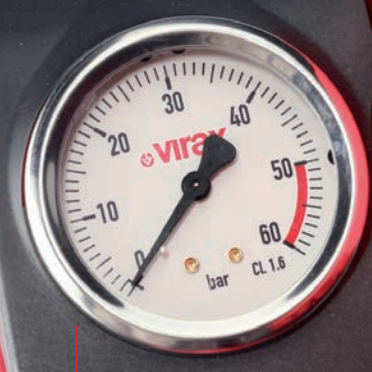
Manometr 50 bar