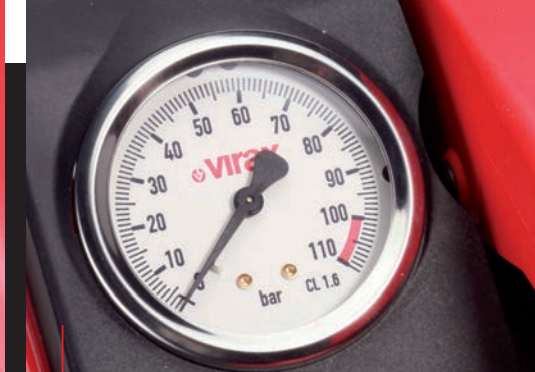
Manometr 100 bar